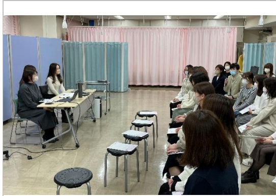
▲ディスカッションの様子