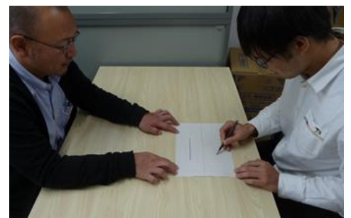
線分模写課題の実施風景

A. 私たちは、ヒトの高次脳機能（認知機能）の中でも注意機能についての研究を進めております。例えば、街中を歩いて目的地にたどり着くためには、他の歩行者や自転車、自動車にぶつからないよう進むことや、そうしながら周りの看板や建物に目を向けることが必要となります。これらが可能であるのは、自分の周囲に対して注意を向けることができるからです。加えて、必要な情報を収集できるからです。脳卒中や交通事故で脳に傷（脳損傷）が生じた場合、これらの行動が困難にある場合があります。このような症状が半側空間無視や全般性の注意障害と呼ばれるものであり、患者さんの生活に大きな影響をもたらすことが知られています。そのため、私たちは、どの様に症状を「見える化」すべきか、新しい検査方法の開発を通して検討しております。特に、紙と鉛筆を用いた簡便な方法が臨床に応用しやすいと考えております。