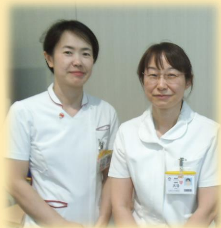
福良(ふくら)、大谷です お気軽にお越しください😊

国立がんセンター中央病院主催 「がん患者の外見ケアに関する研修会」を 修了した当院看護師が担当しています。