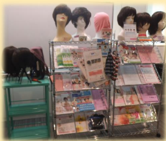
展示のウィッグ、ケア帽子は 試着いただけます